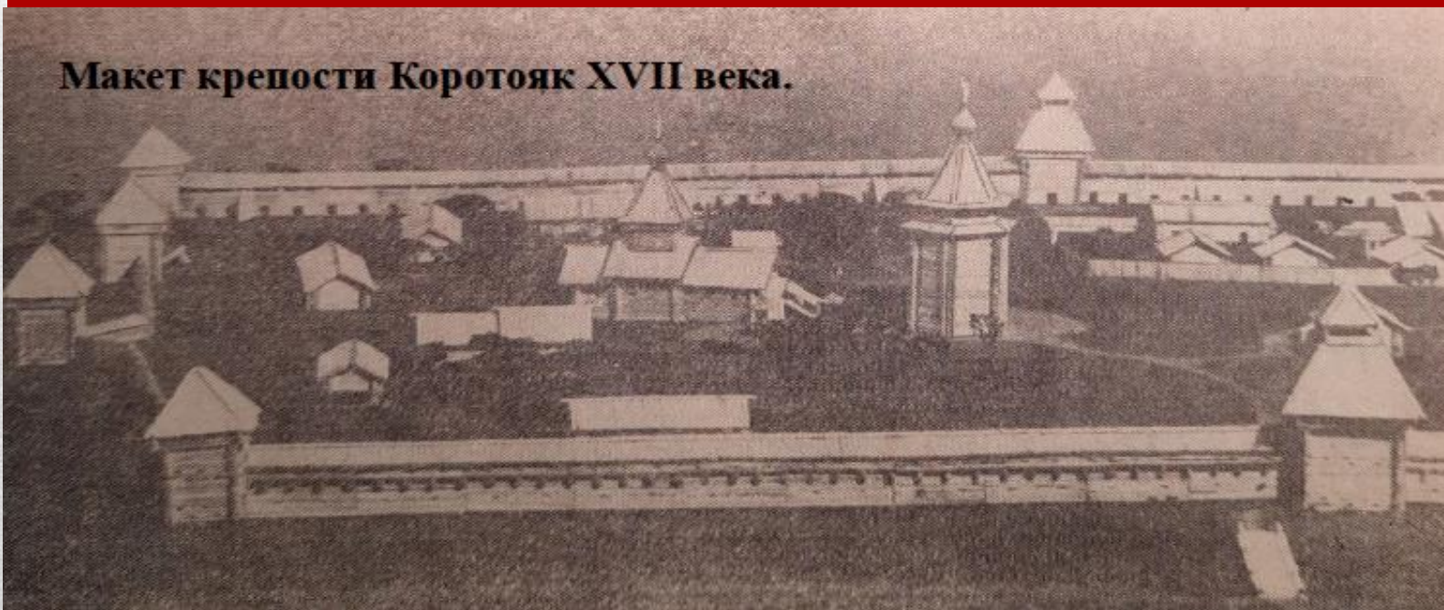
Макет крепости Коротояк XVII века.