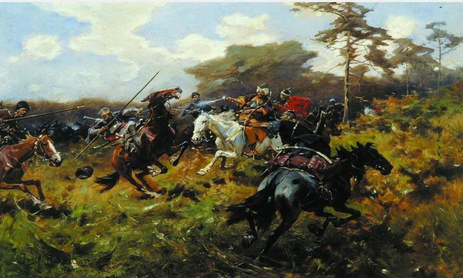
Юзеф Брандт. Схватка казаков с татарами. 1890 г.

Первое упоминание о Коротояке относится к 1642 году, когда группа переселенцев черкас из Речи Посполитой, направлявшаяся в будущий Костёнск – основала поселение Коротояк. Однако частые набеги татар требовали достойной обороны, поэтому вскоре появилась идея – построить крепость.