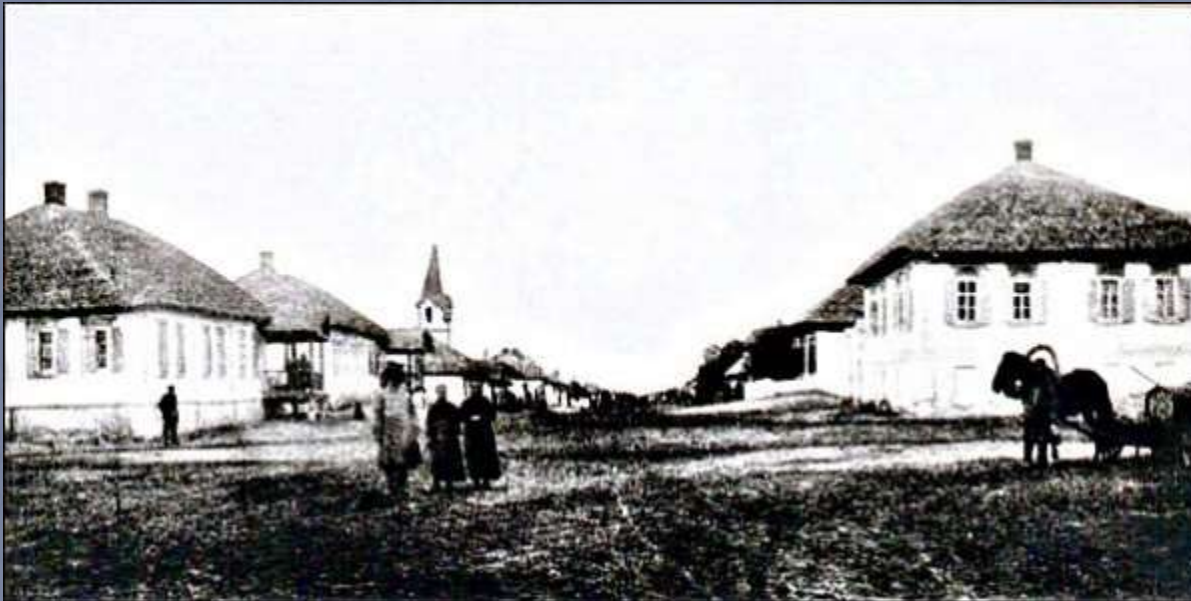
Рибенсдорф в XIX в.

Поселение, состоявшее из двух улиц, походило на немецкую деревню. Деревянные дома с большими окнами были построены на значительном расстоянии друг от друга, в результате чего поселение имело живописный вид