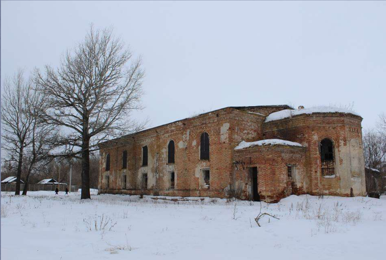
Лютеранская кирха в настоящее время

Однако по мере обострения советско-германских отношений появились стремления к эмиграции. Уже в 1941 году немецкие колонии подверглись депортации. В данный момент на месте Рибенсдорфа находится село Рыбное