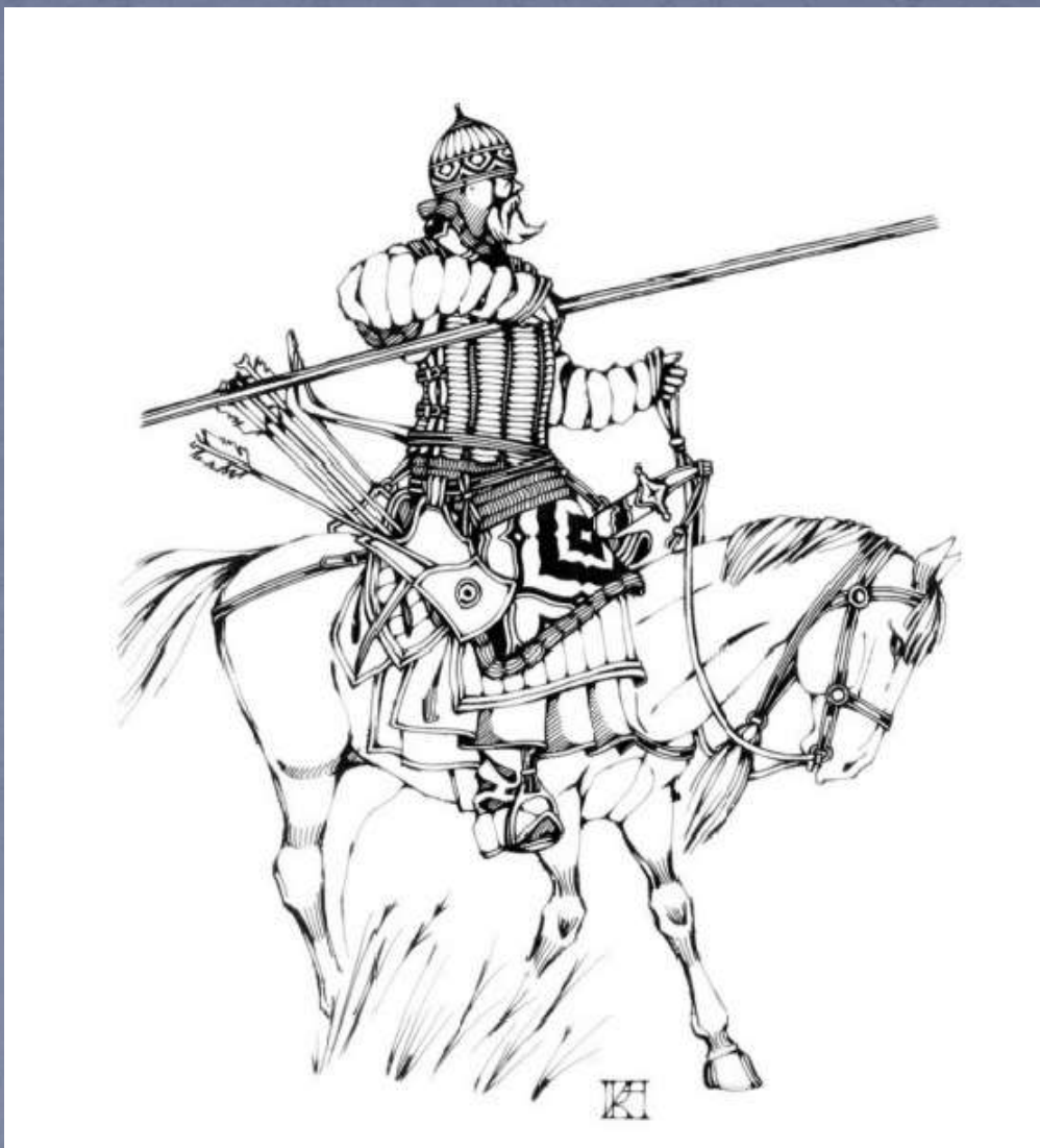
Московский служилый воин XV-нач. XVI вв. Художник Красникова А. В.