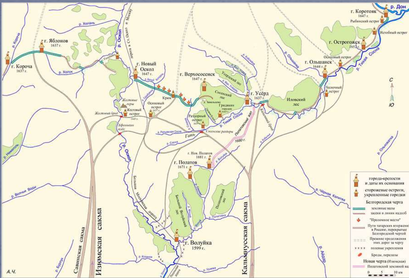
Схема дорог на Белгородской черте. Реконструкция А. Г. Чепухина

Второй этап строительства пришёл на 1646 по 1653 гг. В этот период появились регулярные войска на территории черты, существующие укрепления поддерживались в оснащем состоянии. На карте появились новые города-крепости: Карпов, Болхолец, Орлов, Новый Оскол, Коротоаяк, Верхососенск, Добрый, Сокольск, Урыв, Острогжск. Систему укреплений дополнили Карповский, Новоосколький, Усманский валы