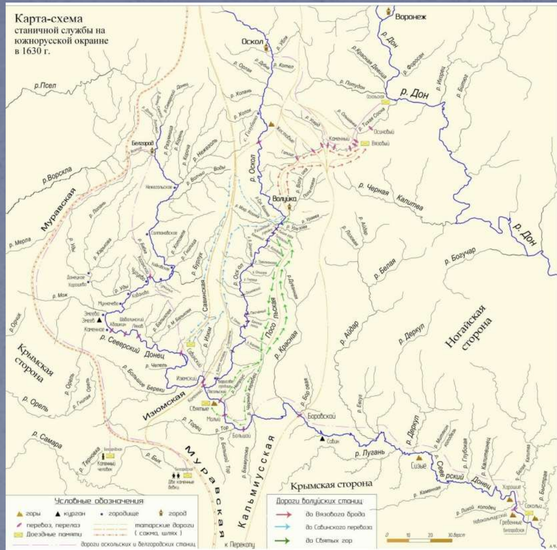
Карта-схема станичной службы на южнорусской окраине в 1630 г.