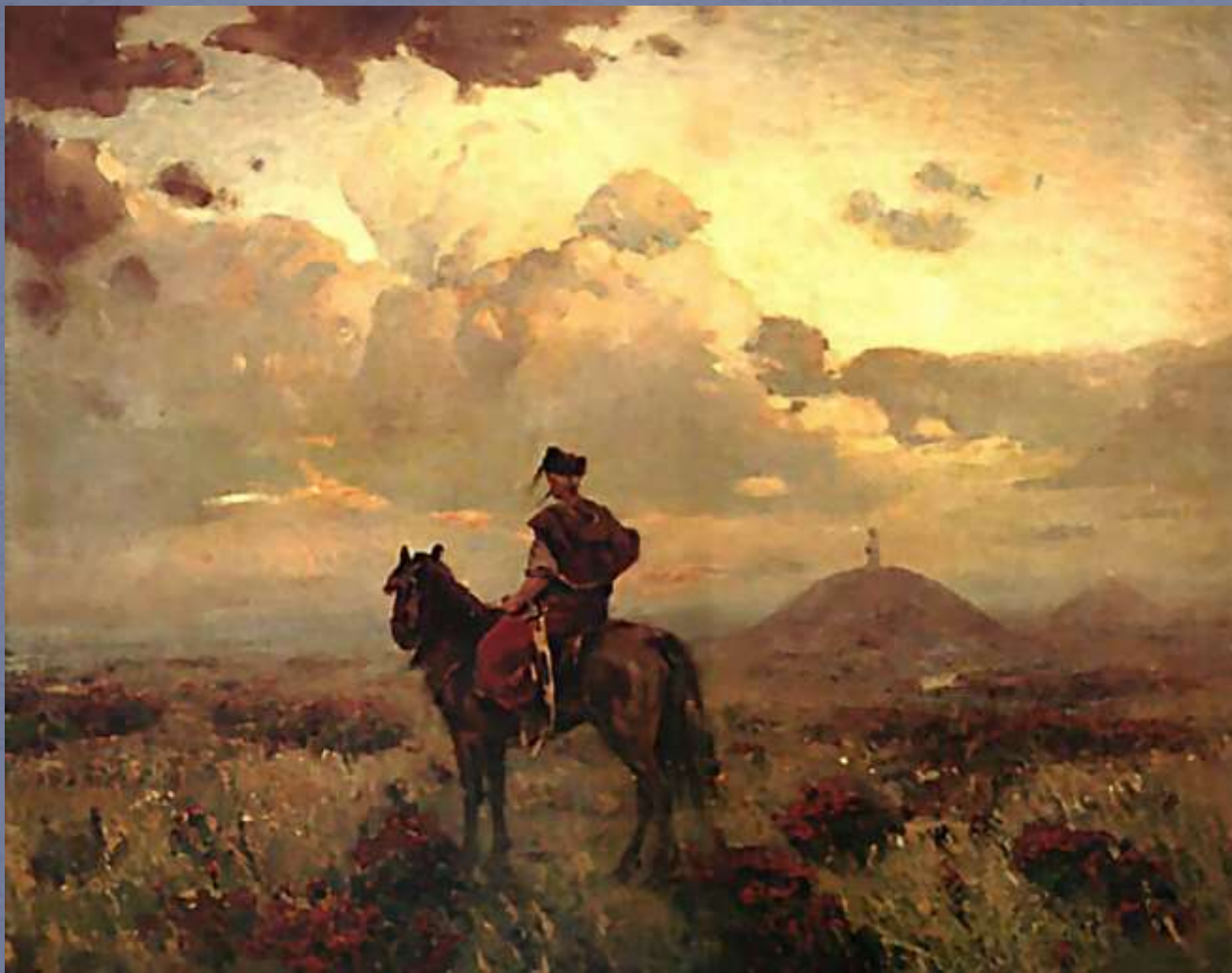
Казак в степи. Тревожные знаки. Художник – Сергей Васильковский

Постройка Белгородской черты с грамотной системой обороны позволила успешно противостоять татарским набегам на южные границы России, значительно снизить их количество и уменьшить потери от действий неприятеля. Эта ситуация способствовала закреплению новых территорий в составе Российского государства, а граница постепенно отодвигалась на юг, сокращая территорию «Поля»