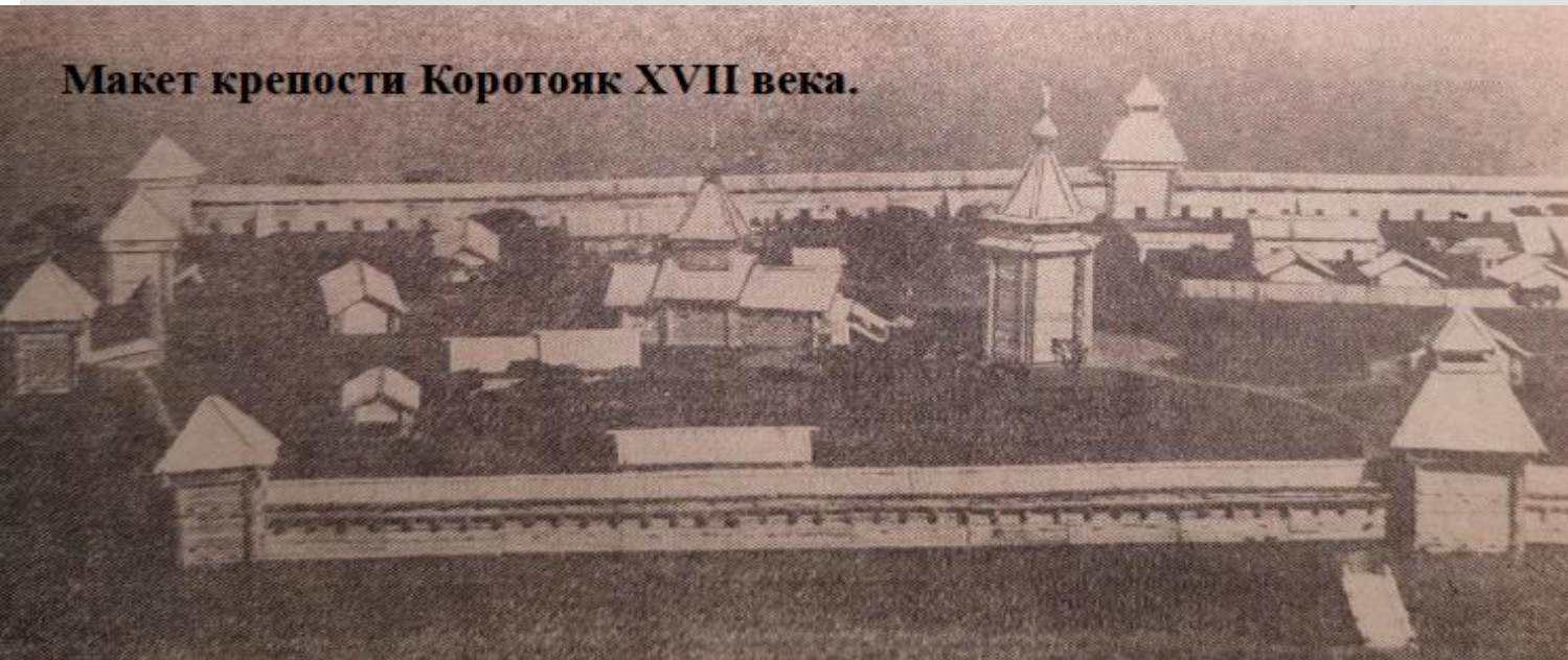
Макет крепости Коротомяк XVII века.

Участие в Азовских походах не прошло для историка даром, вскоре он заболел и скончался.