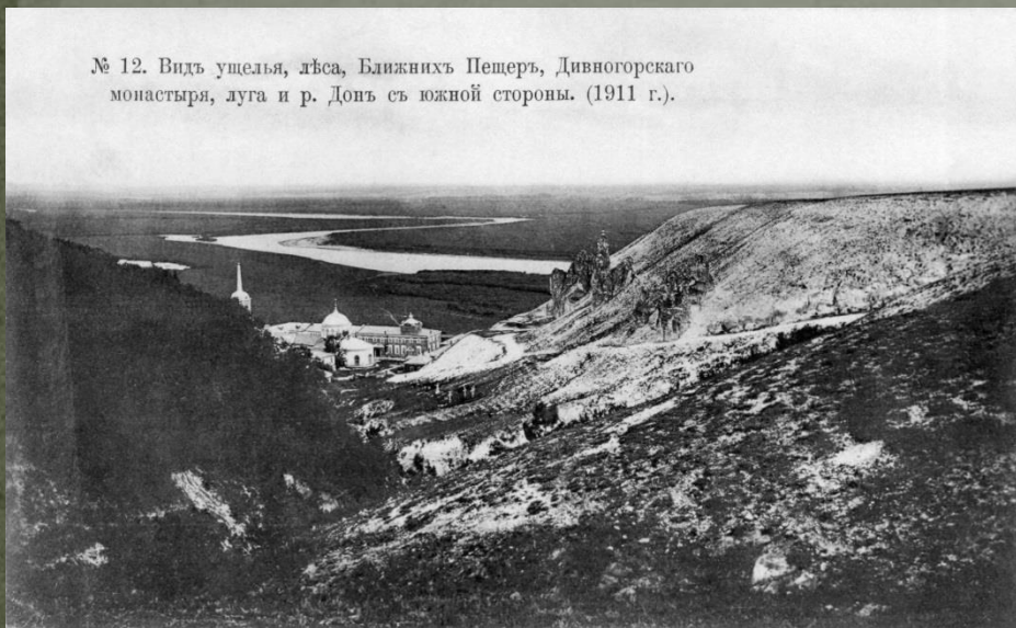
№ 12. Видь ущелья, лѣса, Ближнихъ Пещеръ, Дивногорскаго монастыря, луга и р. Донъ съ южной стороны. (1911 г.).

При сравнении фотографий разных лет, хорошо заметно, как заросла пойма, а также подросли деревья на территории монастыря.