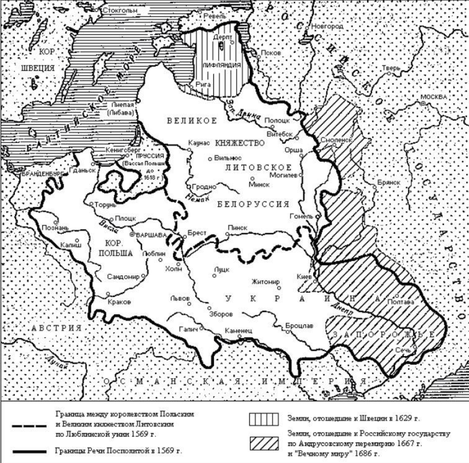
Карта Речи Посполитой в XVII в.

XVII в. в истории территории нынешней Воронежской области был достаточно знаковым, так как именно в этот период земли активно заселялись и осваивались, а территория закреплялась за Русским государством. Предыдущий XVI в. был ознаменован началом колонизации, однако она пришлась на вторую половину столетия. Это были первые попытки, и именно в XVII в. колонизация стала массовой.