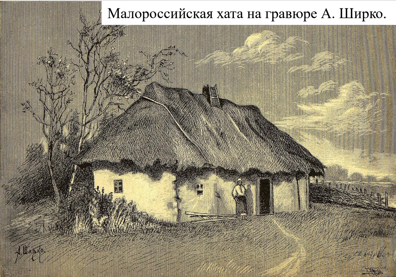
Малороссийская хата на гравюре А. Ширко.

Интересно рассмотреть вопрос угодий более подробно. Дело в том, что этими угодьями периодически пользовались служилые люди из Коротояка, нарушая права черкас. Данный конфликт длился всю вторую половину XVII в. то накаляясь, то снова утихая.