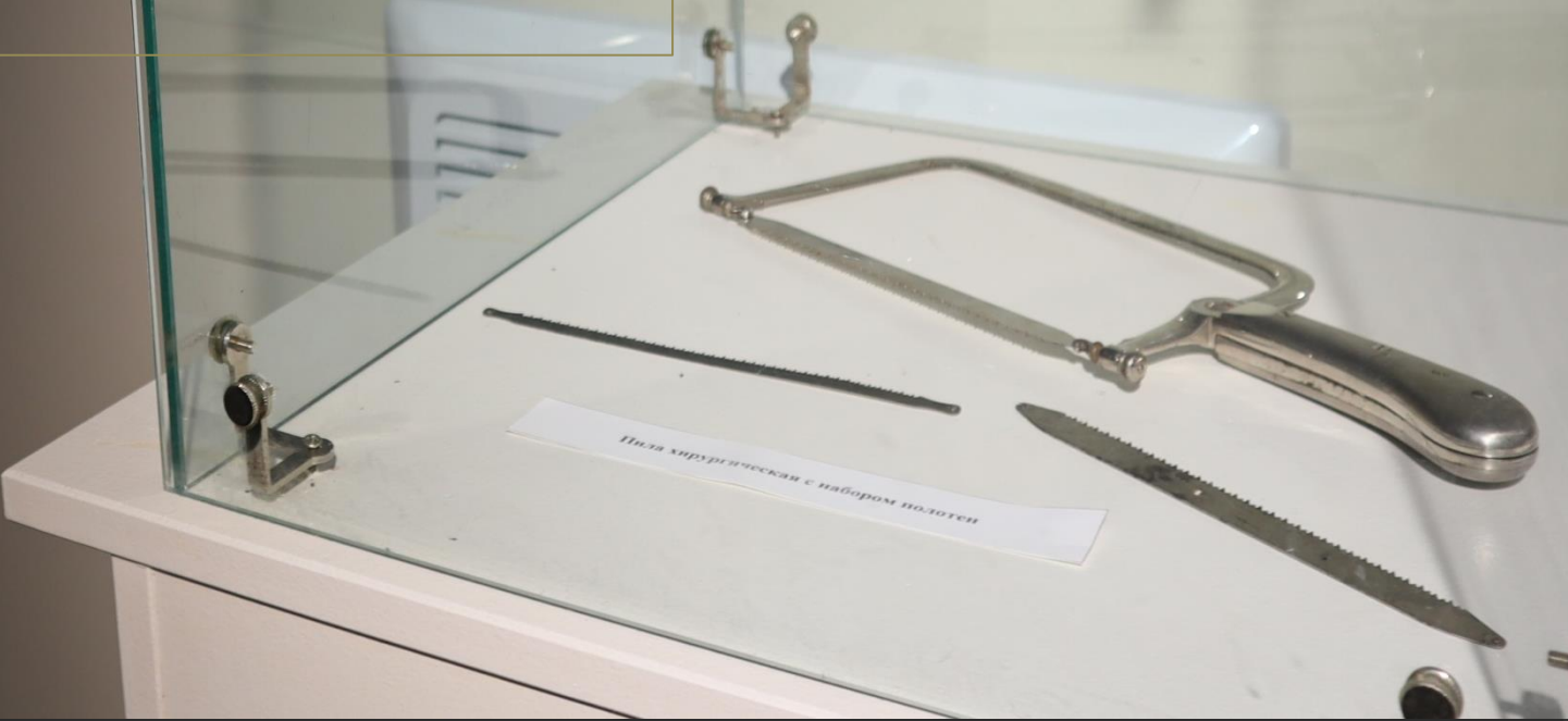
Щип хирургическая с набором полотен

С 1 августа 1941 г. на базе дома отдыха «Дивногорье» был развернут эвакуогоспиталь № 2636. Местоположение госпиталя, рядом с железной дорогой и в двухстах метрах от реки Дон, было очень удобно для транспортировки раненых.