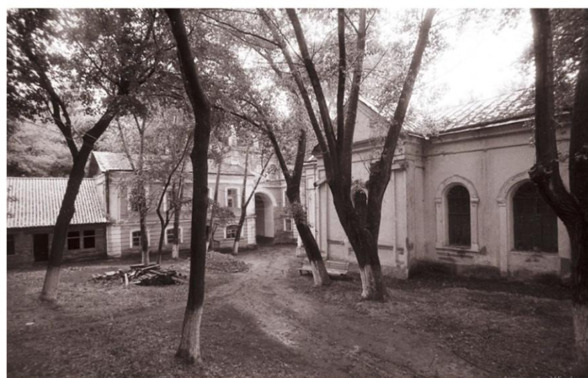
Дивногорский санаторий, 1991 год. С. Смирнов