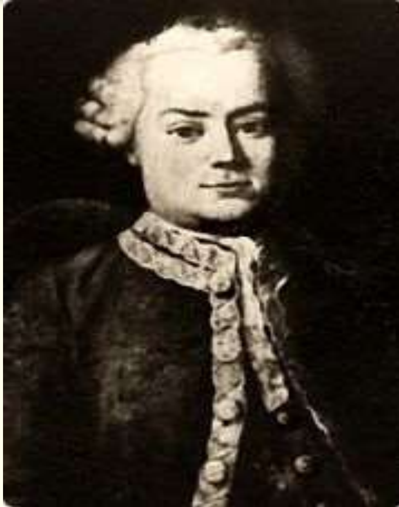
Самуэль Георг Гмелин (1744-1774 гг.)