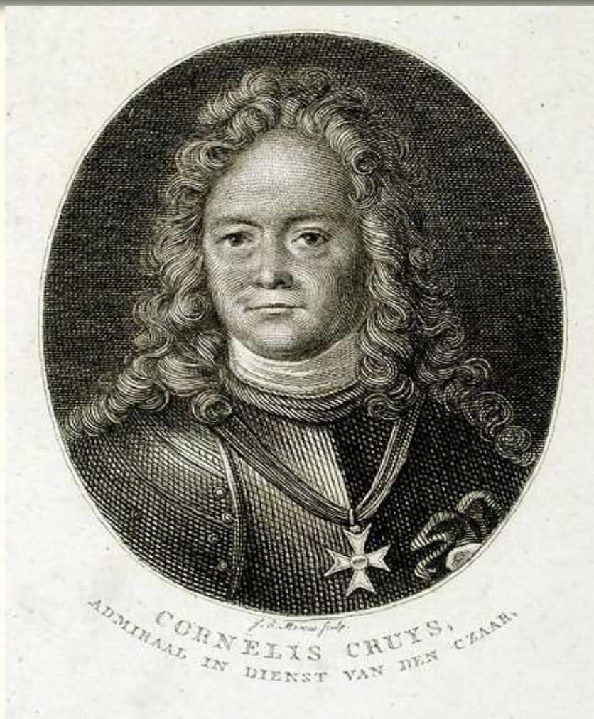
Корнелий Иванович Крюйс (1655-1727 гг.)