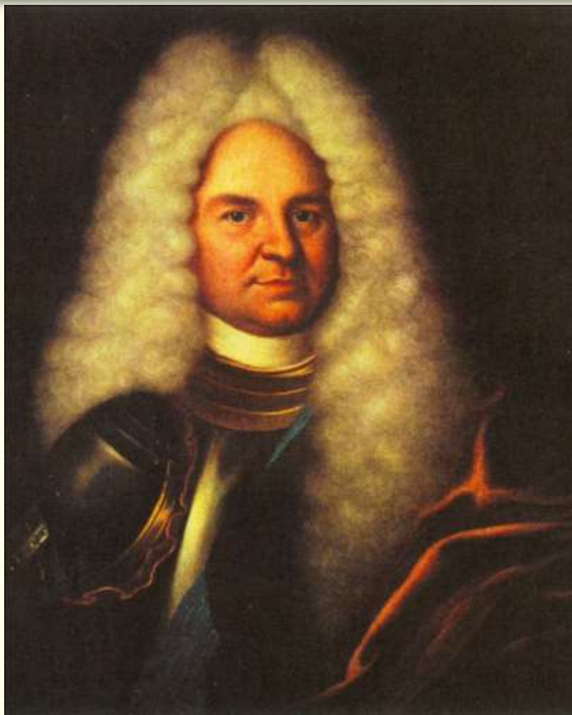
Патрик Леопольд Гордон (1655–1727 гг.)