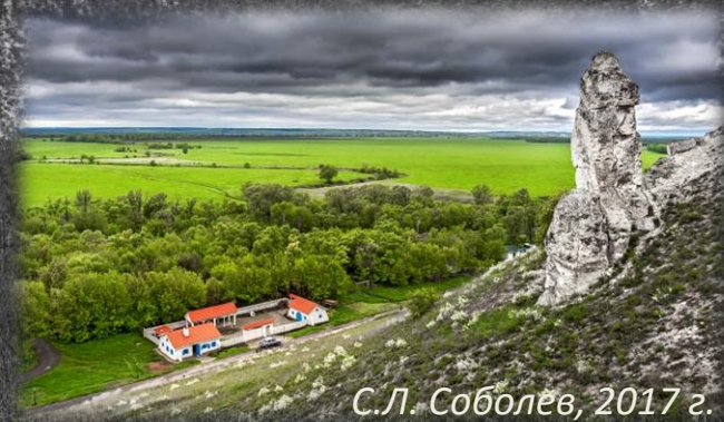
С.Л. Соболев, 2017 г.