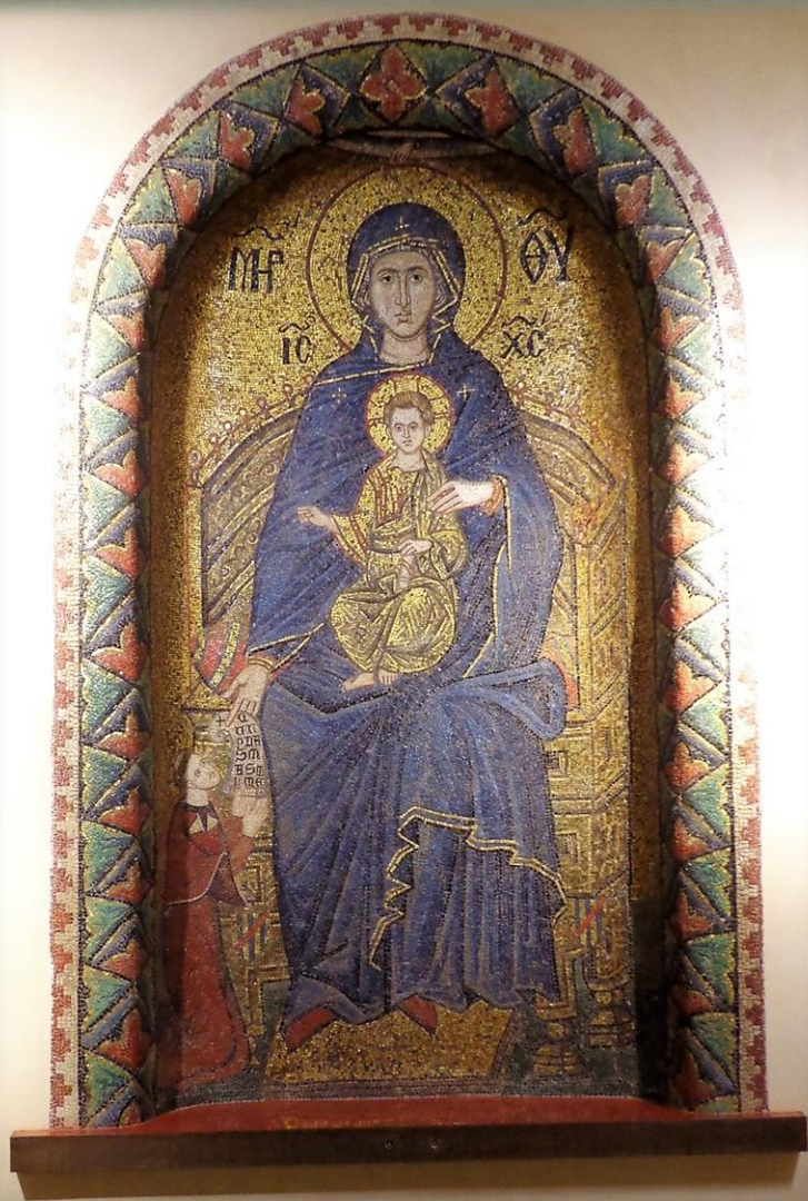
«Мадонна Чиамбретта». XIII в. Museo Regionale, Messina