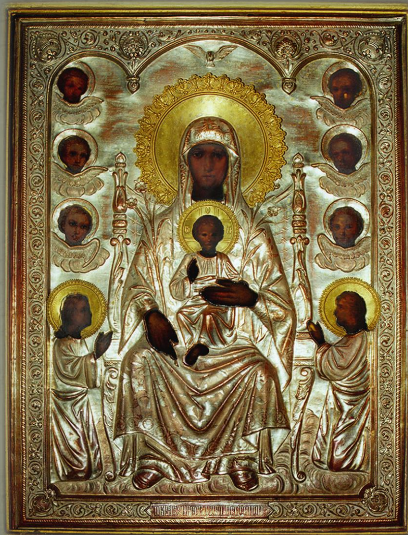
Расположение: г. Алексеевка