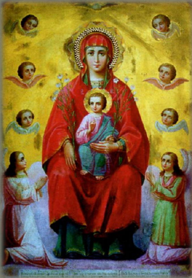
Расположение: г. Россошь

События 1831 г. оказались не единственным чудом от Сицилийской иконы Божией Матери: