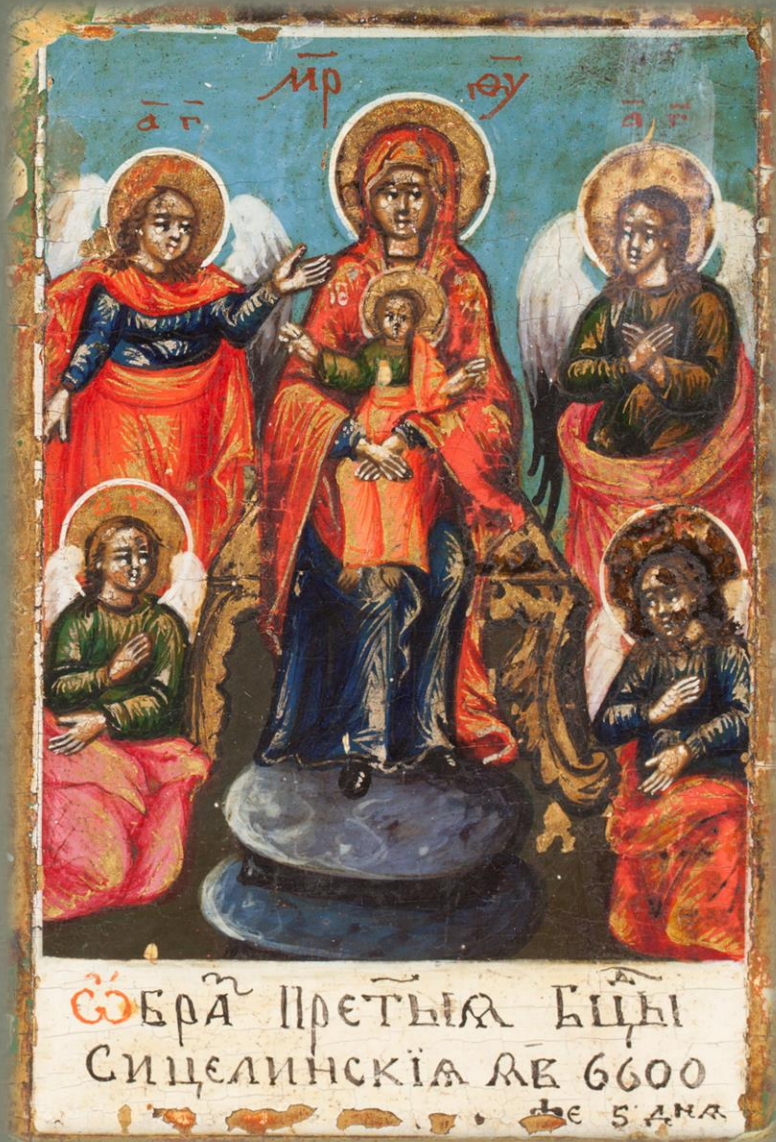
«Богоматерь Сицилийская». Фрагмент свода, 2-я половина XVIII в. Музей им. А. Рублева, Москва

В XVIII–XIX вв. Богоматерь Сицилийская часто встречалась в составе сводов чудотворных икон Богородицы. Сводами называют горизонтальные ряды до ста и более священных изображений. Тогда же широко распространилась дата явления Сицилийской иконы Божией Матери: 1092, или 6600 г. от сотворения мира. Каким было это явление, кто и когда впервые зафиксировал его, – выяснить пока не удалось.