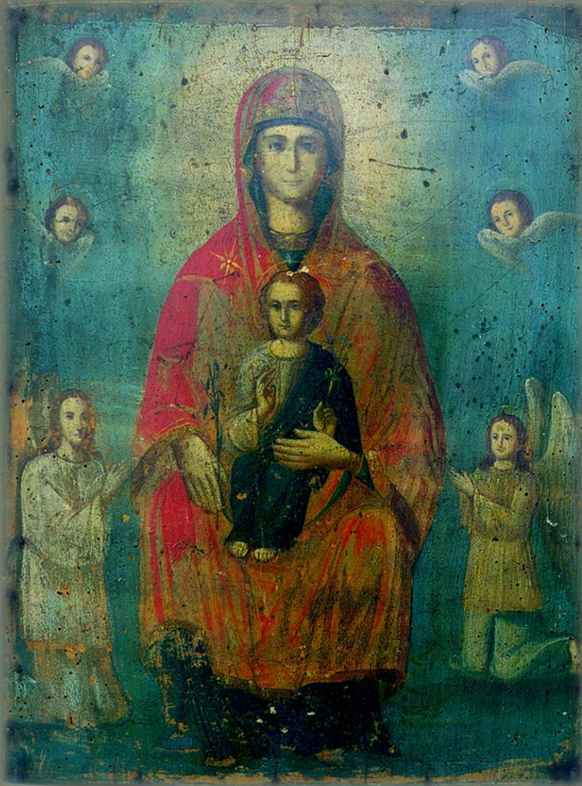
Расположение: г. Алексеевка

После Октябрьской революции 1917 г. и установления власти большевиков Дивногорская обитель была упразднена, а Сицилийская икона Божией Матери – утеряна.