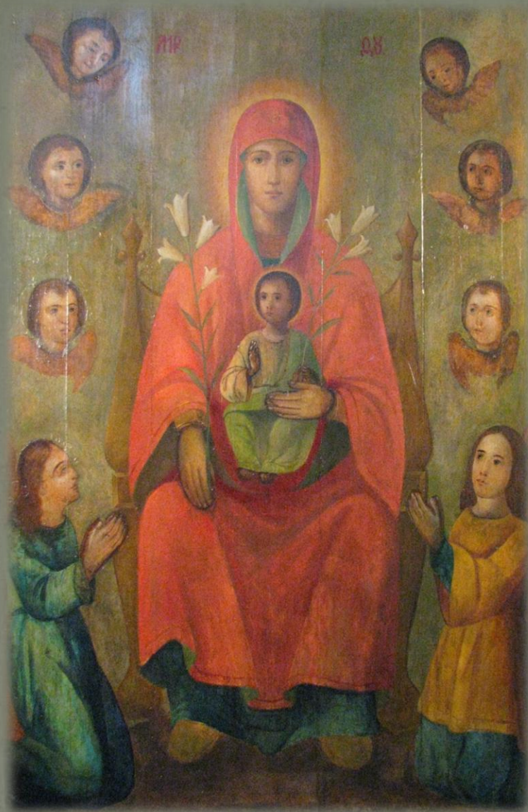
XIX в. Музей-заповедник «Дивногорье»