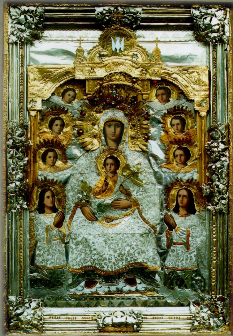
Расположение: п.г.т. Каменка

Архимандрит Димитрий (Самбикин) предполагал, что икона принесена православными греками, после падения Византии (1453) бежавшими в Италию, а оттуда – в Россию. Как и А. Кременецкий, доказательств он почти не приводит.