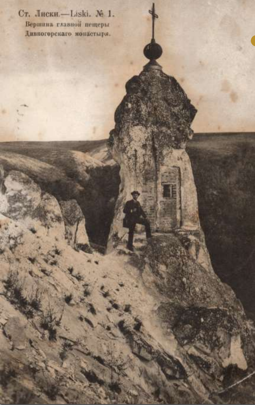
Ст. Лиски.—Liski. № 1. Вершина главной пещеры Дивногорского монастыря.