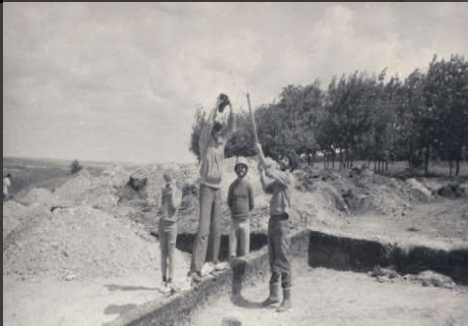
Венгерские археологи на раскопках Маяцкого поселения в 1982 году.