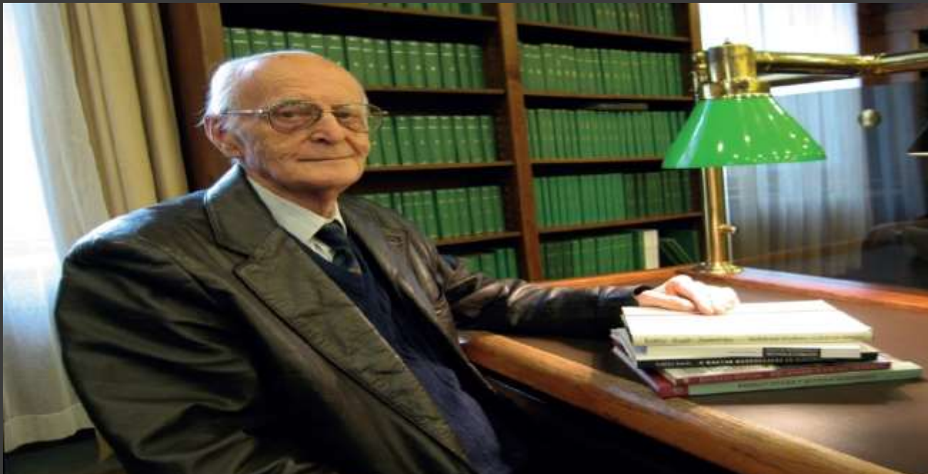
Иштван Эрдели в Библиотеке Венгерской Академии Наук в июне 2018 года, Будапешт.

Дивногорье занимает в этом ряду не последнее место, так как здесь венгерский археолог провёл шесть полевых сезонов и оставил после себя ряд статей, посвящённым венграм на Дону. Его коллеги отмечали, что он имел своё видение ситуации, но не отказывался выслушать других.