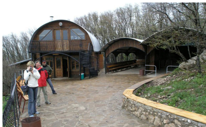
Пещера Эмине Баир Хосар. Привходовой комплекс.

нижнем Баире был устроен подземный лагерь и экспедиция работала под землей, без выхода на поверхность в течение 8-ми дней. Во время экспедиции была проведена фотодокументация пещеры, при проведении топосъемки в пещере были открыты новые